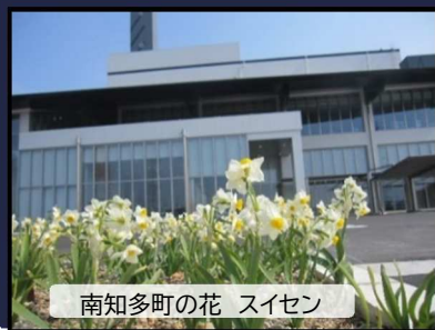
南知多町の花 スイセン

管理棟では、見学時に見ていただく環境学習関係の設備の据え付けが行われました。建設工事日より最終号となる今号では、最終工程である環境学習関係の設備の見どころと見学時おすすめの体験ミッションをご紹介します！