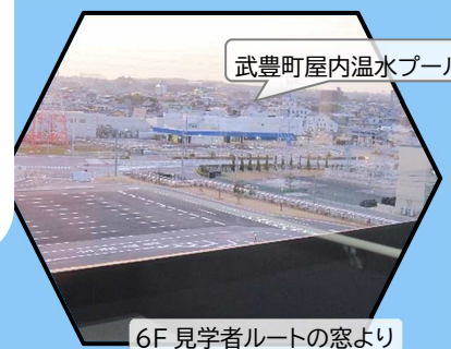
武豊町屋内温水プール